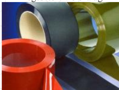
Hegesztő PVC szalag