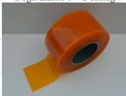
Bogártaszító PVC szalag