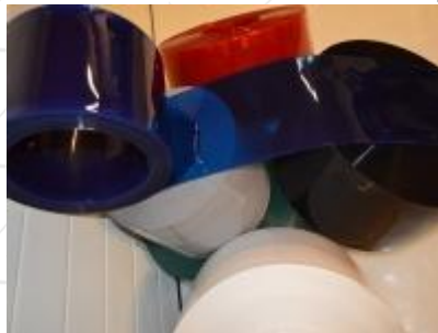
Normál sima Színes PVC szalag