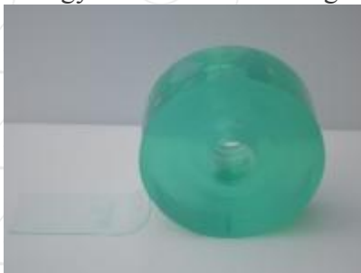
Fagyálló sima PVC szalag