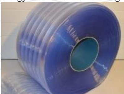
Fagyálló bordás PVC szalag