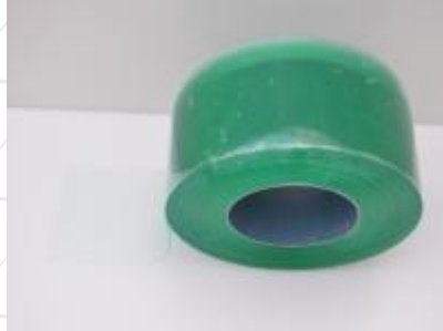
Normál sima Antisztatikus szalag